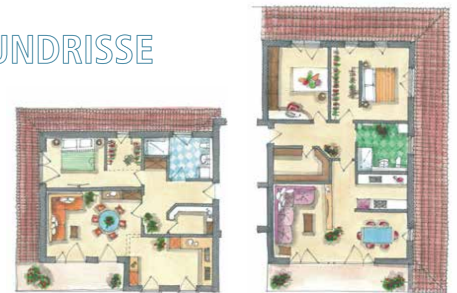
2. OG: 79,64 m 2