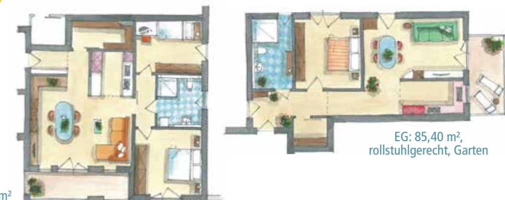
EG: 103,68 m 2