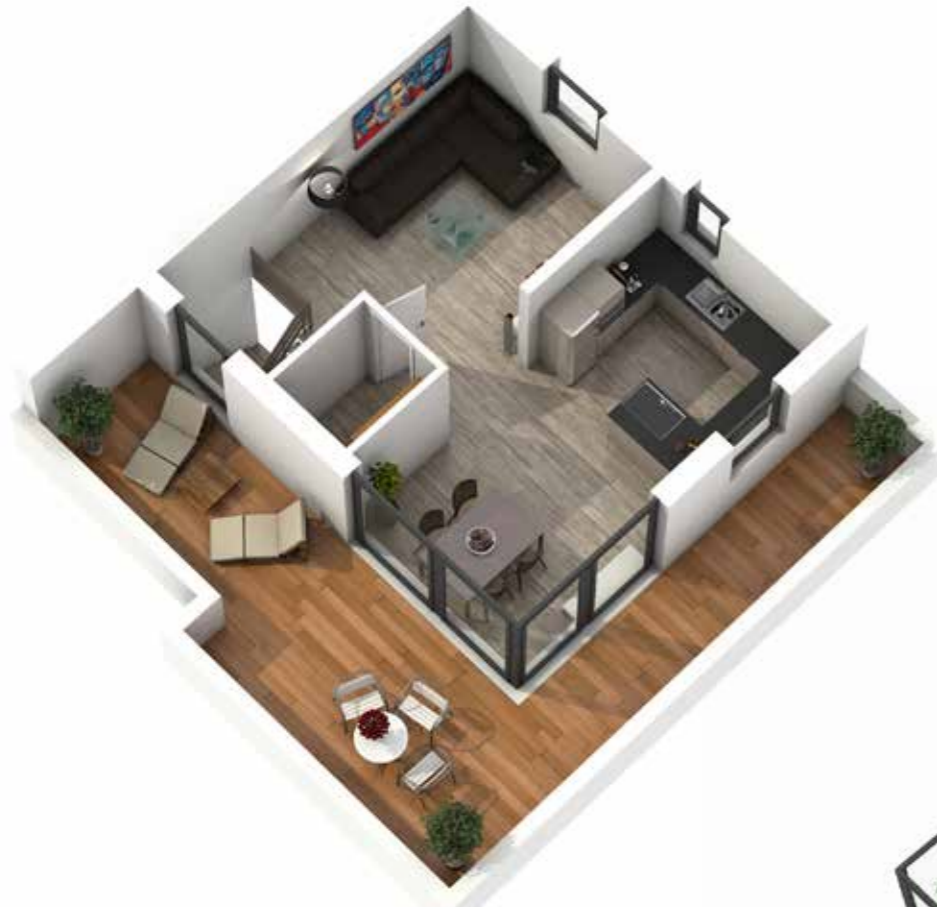
WE 3 1.+2. OG 110 m 2