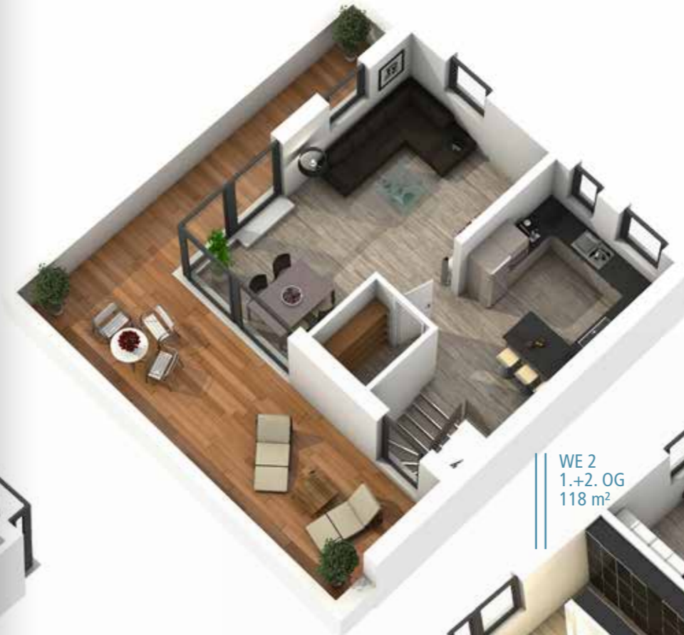
WE 2 1.+2. OG 118 m 2