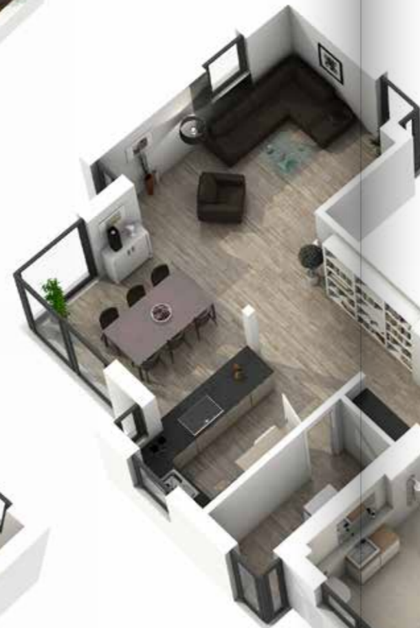
WE 1 EG 124 m 2