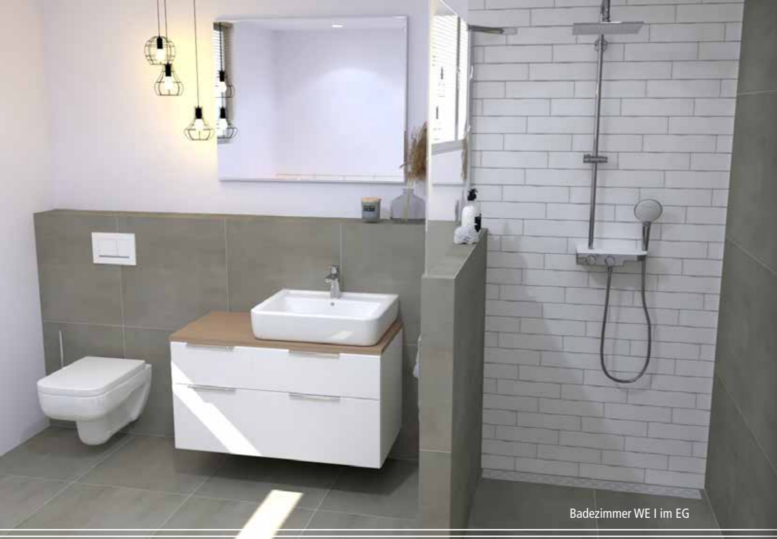
Badezimmer WE I im EG